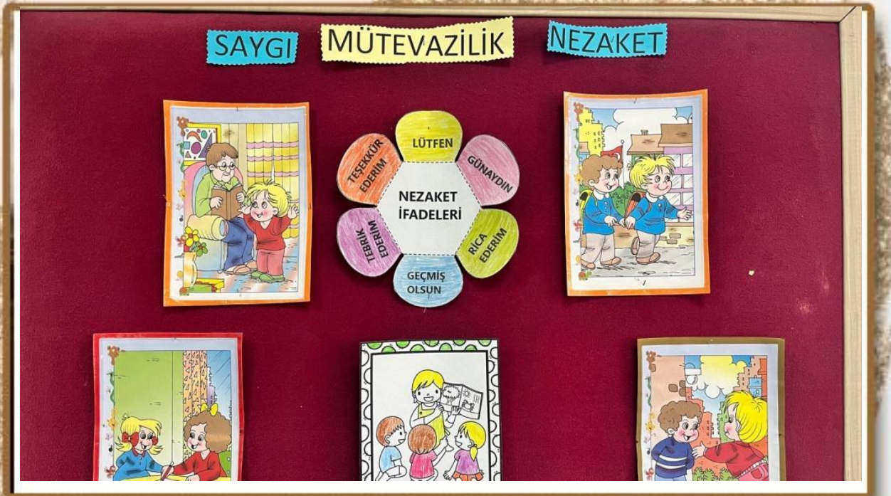
ÇEDES ETKİNLİK PANOMUZ