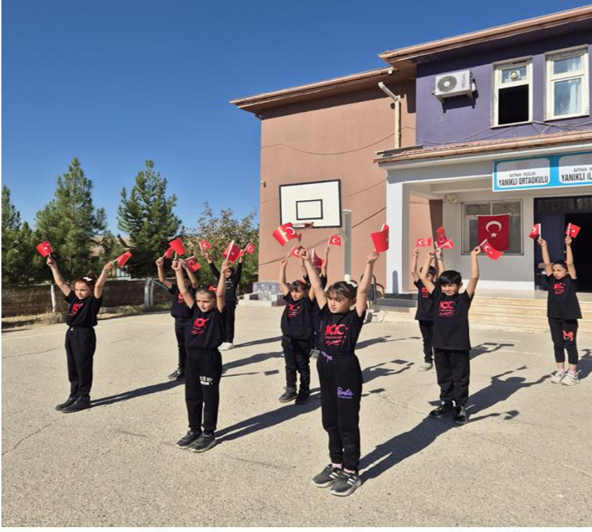
29 EKİM CUMHURİYET BAYRAMI KUTLAMALARI