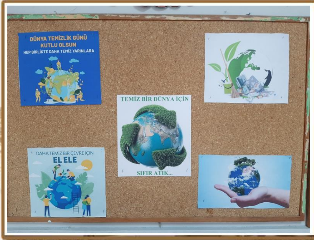
DÜNYA TEMİZLİK GÜNÜ