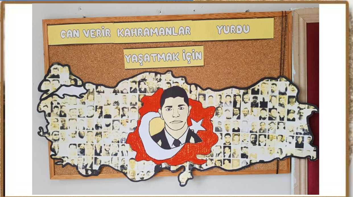
15 TEMMUZ ŞEHİTLERİ PANOSU